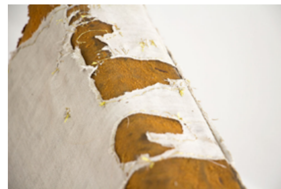
Le fauteuil , fauteuil, fil doré, 2018