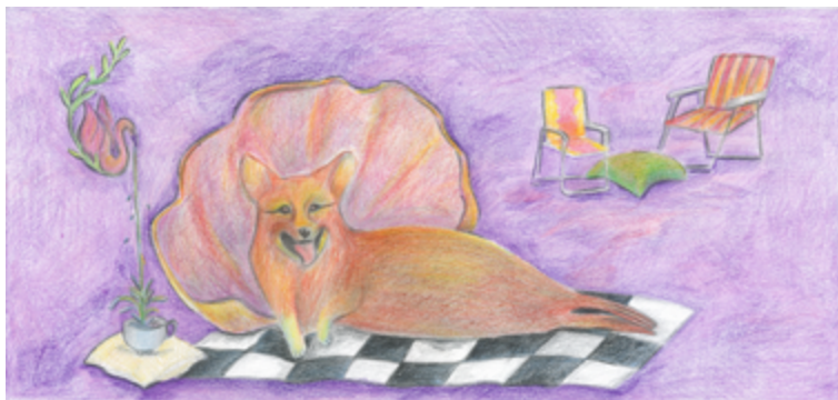
La Chirène , 2021. Pour co-co, publication du basculeur, carte postales, 100 exemplaires.