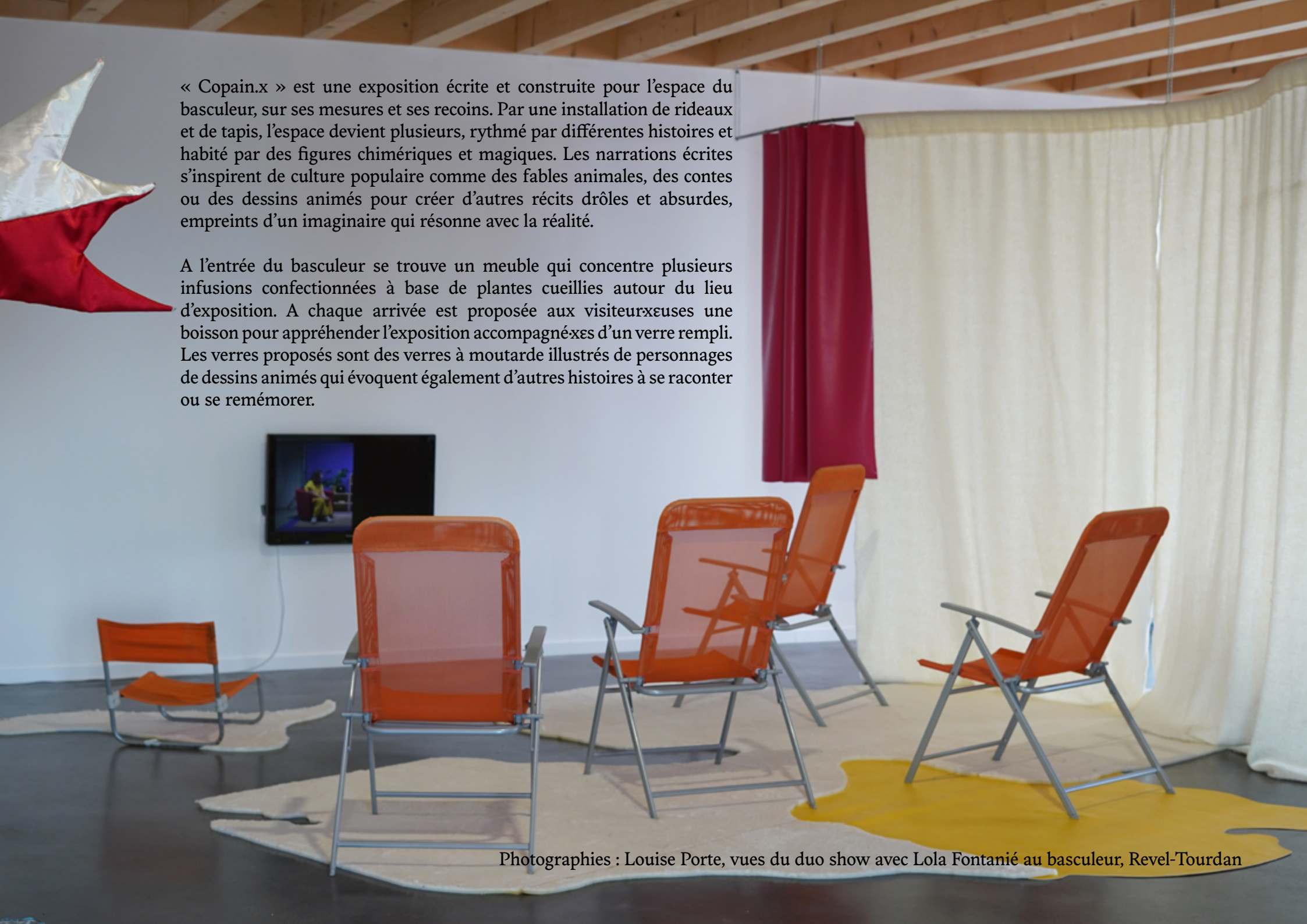
vues du duo show avec Lola Fontanié au basculeur, Revel-Tourdan

A l'entrée du basculeur se trouve un meuble qui concentre plusieurs infusions confectionnées à base de plantes cueillies autour du lieu d'exposition. A chaque arrivée est proposée aux visiteurx·euses une boisson pour appréhender l'exposition accompagnée d'un verre rempli. Les verres proposés sont des verres à moutarde illustrés de personnages de dessins animés qui évoquent également d'autres histoires à se raconter ou se remémorer.