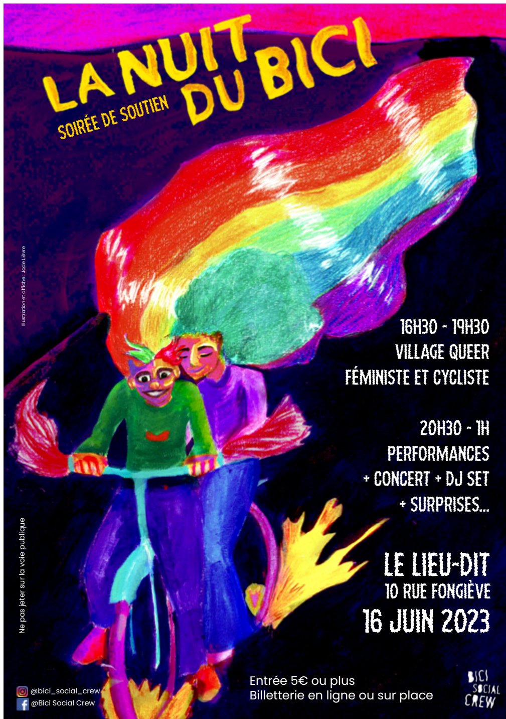
Affiche «La nuit du Bici», 2023. Pour l'association féministe «Bici Social Crew, Clermont-Ferrand