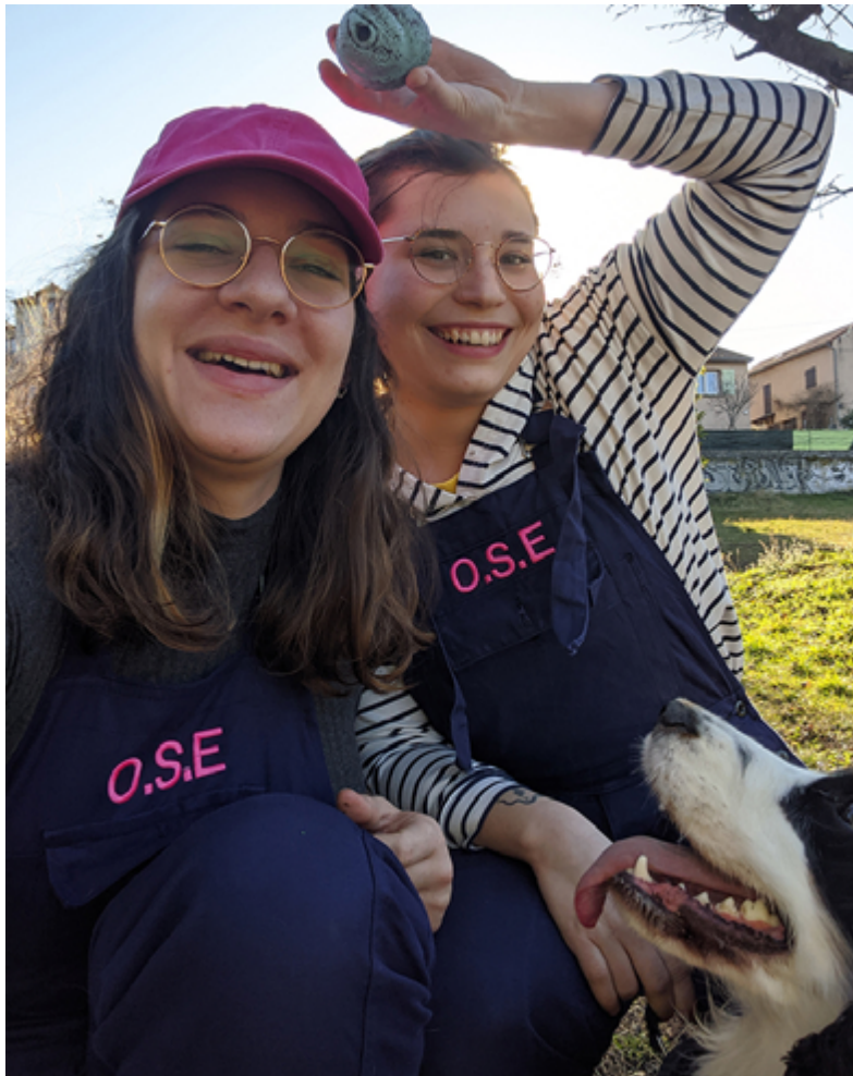
Opération Services Efficaces , 2019. Entreprise de services.

*Notre équipe se réserve le droit de refuser certaines demandes.»