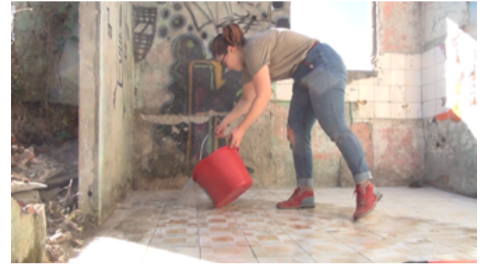
Séance de soins attentifs , action de sept jours pour un espace défini dans un site à l'abandon, Porto, Portugal, 2017